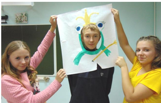
Рома думал и гадал, но Царевну-лягушку назвал