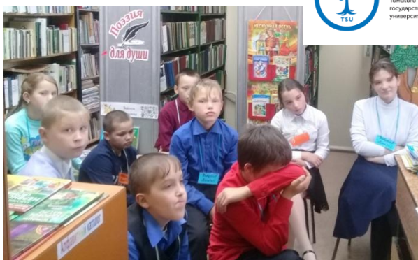
Долго мы смотрели, очень поумнели

Ребята 5 и 6 класса были приглашены в библиотеку на виртуальную экскурсию по библиотеке ТГУ города