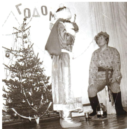
ный концерт к Дню Великой Октябрьской Революции. На

культурно - массовая работа проводилась совместно с клубом, на сцене, в фойе, или на танцплощадке. Клуб и библиотека принимали активное участие в жизни села, проводили Дни села с ярмарками, выставками изделий односельчан, Дни молодежи, игры, «Рождественские посиделки», «Колядки». На фото вверху в новогодней сказке. На фото в центре традицион-